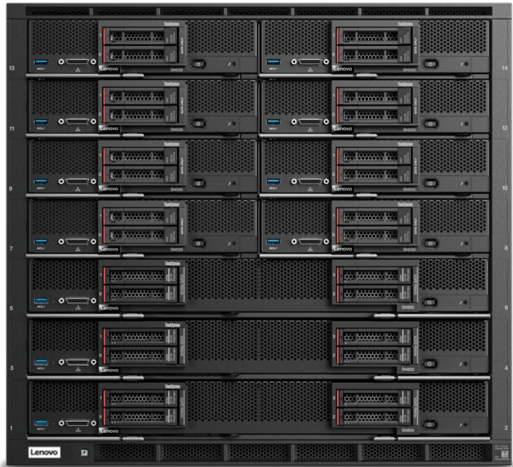
В шасси Flex System Enterprise Chassis можно установить до 14 вычислительных узлов SN550, обеспечив высокую плотность размещения ресурсов в стойке.

Flex System помогает экономить время и деньги, существенно сокращая расходы на электроэнергию, место в дата-центре и пространство в стойке, а также упрощая управление. Это простое и удобное решение поможет создать экономичную инфраструктуру, отвечающую требованиям завтрашнего дня.