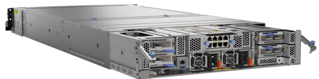
Революционная конструкция модулей ввода-вывода в задней части шасси D2 обеспечивает максимальную гибкость ультракомпактной платформы SD530.

Оба модуля ввода-вывода поддерживают 10Gb Base-T, 10Gb SFP+ или варианты без LOM, позволяя устанавливать только те платы LOM/NIC, которые наилучшим образом удовлетворяют требованиям к сетевым подключениям в рамках бюджета. Модули ввода-вывода поддерживают широкий спектр адаптеров расширения, включая OmniPath и InfiniBand для задач высокопроизводительных вычислений и искусственного интеллекта, а также весь диапазон карт Ethernet и Fibre Channel для более традиционных корпоративных и облачных сред.